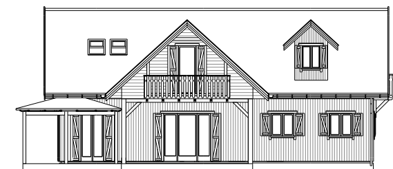
ALÇADO LAT. ESQUERDO