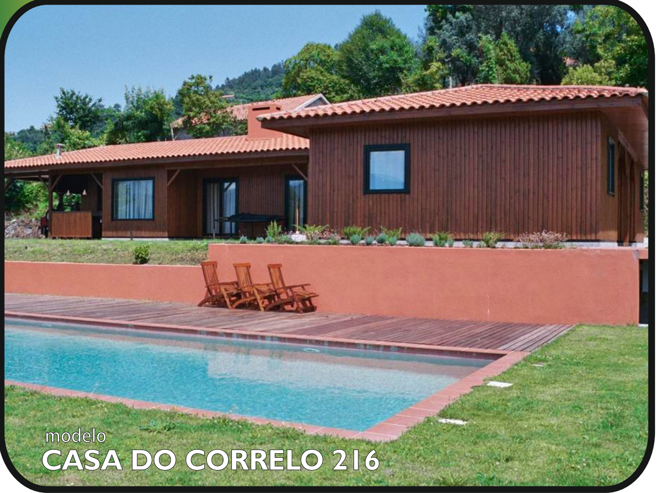
modelo CASA DO CORRELO 216

Telefone: 256 098 964 - Telemóvel: 910 924 638 - Web: www.casmal.pt - Email: geral@casmal.pt