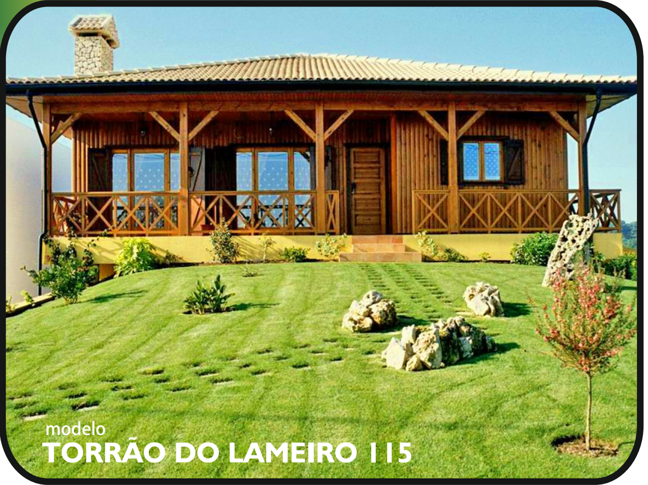
modelo TORRÃO DO LAMEIRO | 15

Telefone: 256 098 964 - Telemóvel: 910 924 638 - Web: www.casmal.pt - Email: geral@casmal.pt